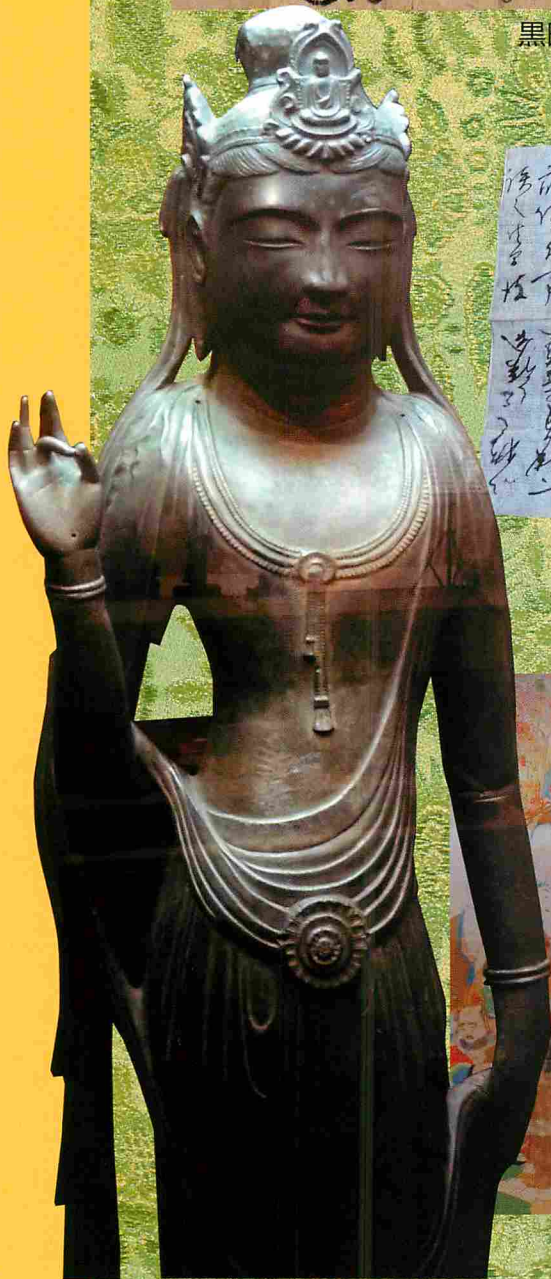
あいたた観音さま