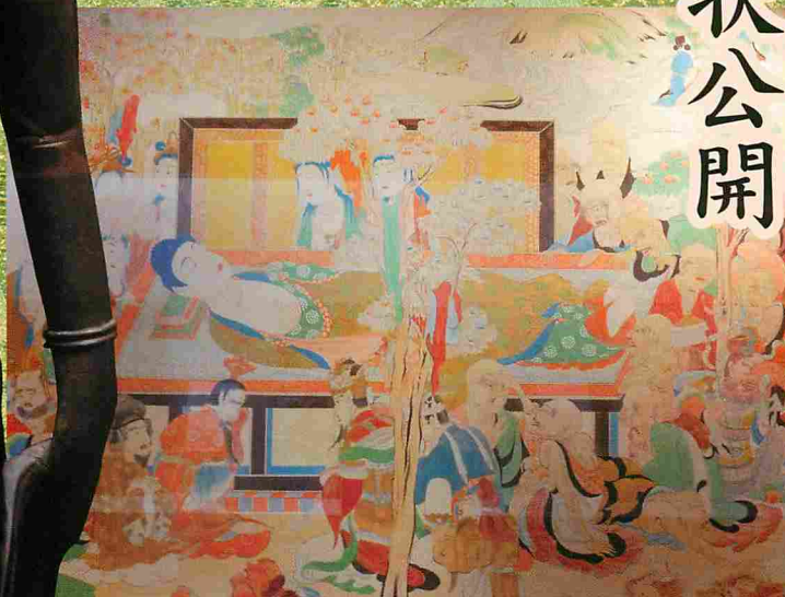
太子堂壁画(復元模写)