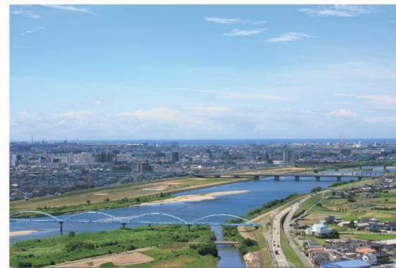
山頂からの景色(加古川俯瞰)

升田山は、標高約105mで一級河川加古川に隣接しています。山頂から見渡すと、北に平荘湖、南には加古川の流れと市中心部を経て、はるか播磨灘まで遠望できます。升田山の南面には、自然にできた石段(八十の岩橋)があり、80人の神が天と地を行き来していたという伝説が「播磨国風土記」に記されています。