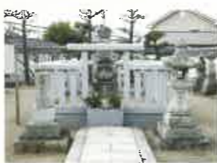
県指定文化財：石造五輪塔