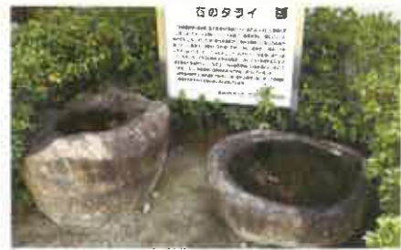
双子の皇子の産湯に使ったといわれのある石のタライ

子の産湯に使ったといわれのある石のタライが、神社南方約1.5キロの加古川町美乃利の民家の軒先にあります。