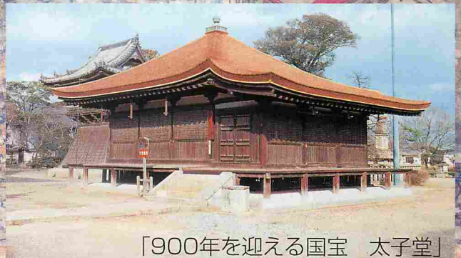
「900年を迎える国宝 太子堂」

主催：鶴林寺／共催：鶴林寺文化財保存会／特別協力：朝日新聞社／後援：毎日新聞社・神戸新聞社・BAN-BANネットワークス(株)