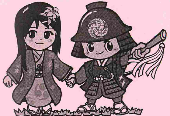
てるひめちゃん&かんべえくん

◆その他 5月27日（月）正午を申込締切り（必着）とし、応募者多数（定員200名）の場合は抽選となります。