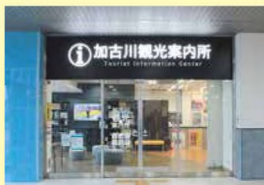
加古川観光案内所 入口