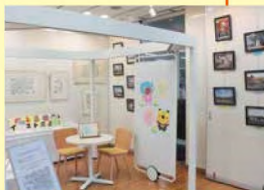
作品展示コーナー