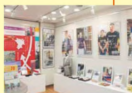
ふるさと納税展示コーナー