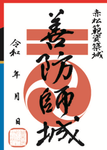
(ぜんぼうしじょう)