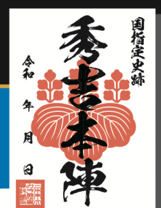
(ひでよしほんじん)